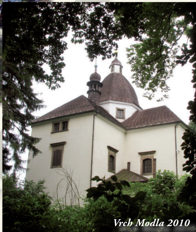
Vrch Modla 2010