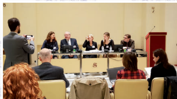
Představení profesní komory Sanátor v římském senátu – 8. 11. 2018