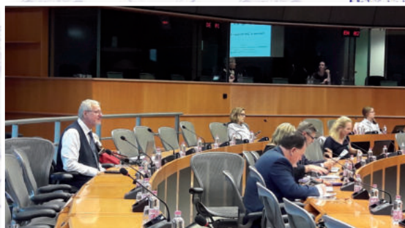
Mezinárodní konference o CAM v Evropském parlamentu – 16. 10. 2017