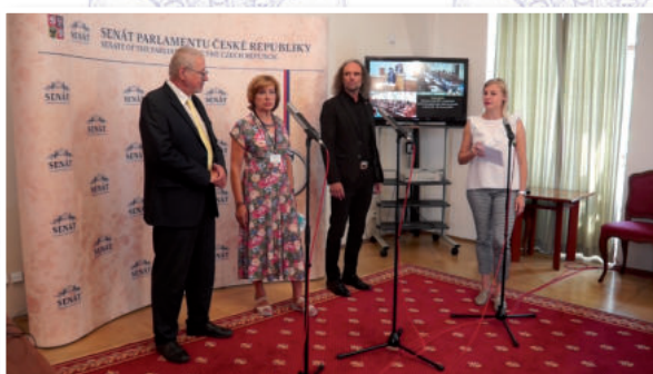
Předání petice v Senátu Parlamentu České republiky – 18. 7. 2018