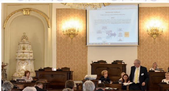
Veřejné slyšení v Poslanecké sněmovně ČR 29. 5. 2018