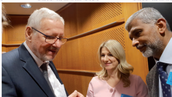
Den ájurvédy v EP, Brusel – 21. 11. 2018