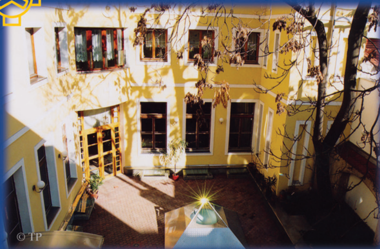
Dům Biotronické centrum sociální pomoci